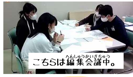
こちらは編集会議中。